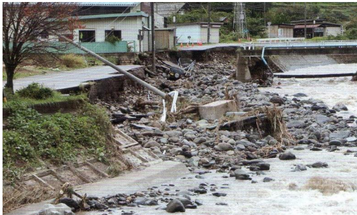
<大門落合地区の国道152号線道路> <長久保地区 五十鈴川の橋>

私たちの学者村別荘地及び地元長和町では、当オーナーの会事務局が把握している限り人的な被害はありませんでした。その反面、道路などのインフラ面と農業関係の被害は甚大(町の試算ではおよそ20億円程度)と言われています。長和町や周辺地域ではこの原稿を書いている今現在も各所で道路の通行制限や復旧工事が続いており、学者村内でも倒木や土砂崩れ等のため、2期を中心に一時は道路の通行止め(現在は開通)や、建物の被害もありました。